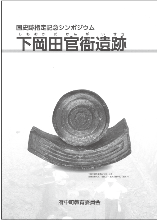
シンポジウムで配布された資料