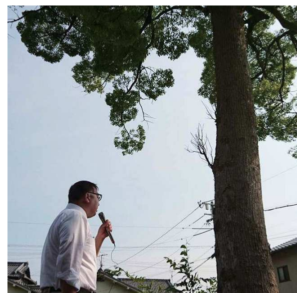
クスノキさんに向かって演説

今日のパートナーは、昭和2年生まれ、国労の活動家だったOさん。もうだいぶ前になくなった親父と同じ生まれ年です。来年には90歳になるんですね。