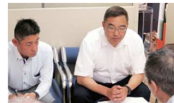
府中町生活環境部と交渉(5月27日)